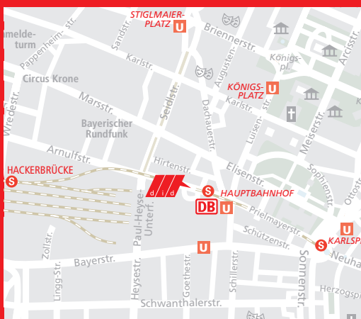
Lage des did deutsch-institut München