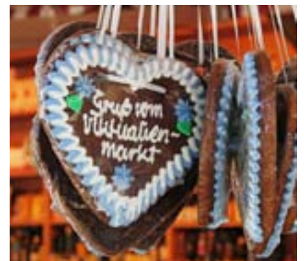
Viktualienmarkt | Lebkuchen