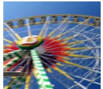
München | Oktoberfest

Language Travel Magazine Star Award for best German Language School